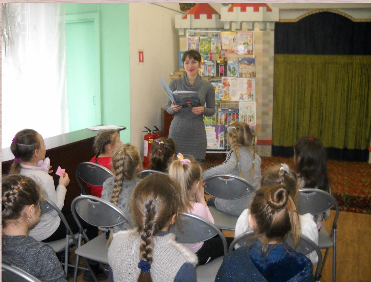
Книга Олександра Дерманського «Жменька тепла для мами»