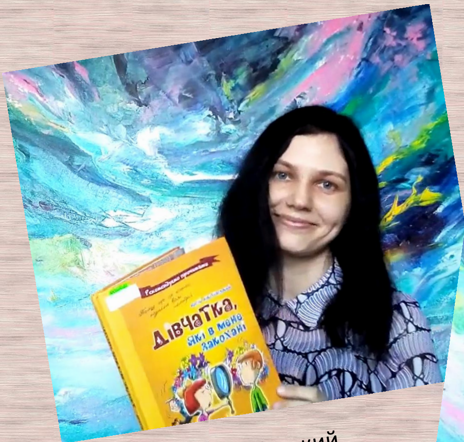
Юрій Нікітінський «Дівчатка, які в мене закохані»